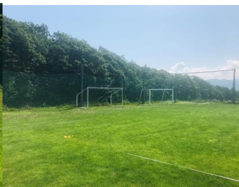
Cグラウンド全体の様子